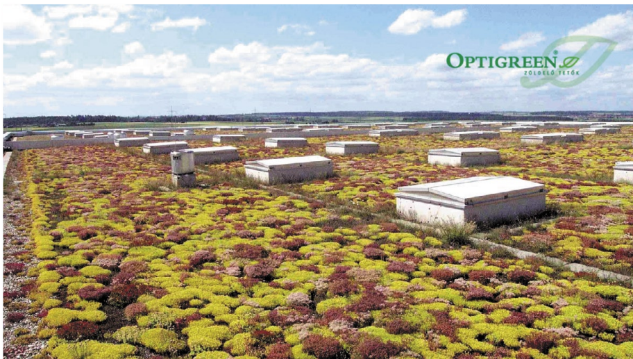
50.000 m 2 Optigreen-extenzív zöldtető víz visszatartása – a régiók éves csapadék össz mennyiségétől függően – kb. 28.000 m 3 /év